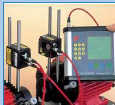
Sistemas de alineación de ejes Tecnología láser.