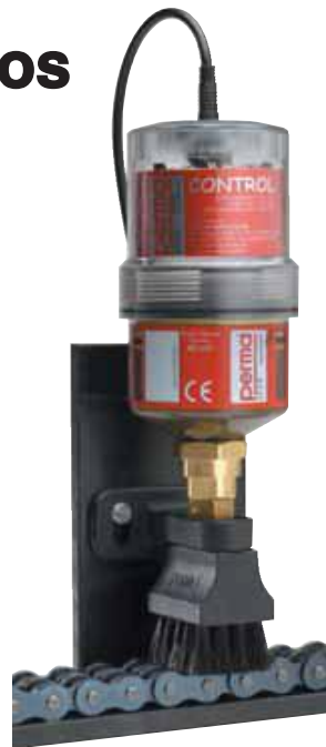
PERMA Star Control Accionamiento electroquímico (accionado a máquina), independiente de la temperatura.