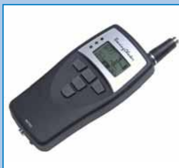
Controlador de rodamientos.