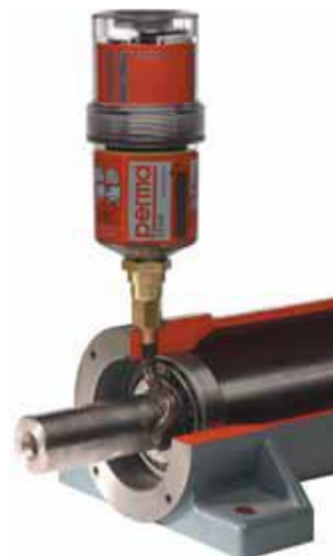
PERMA Star Vario Accionamiento electromecánico (accionado por batería), independiente de la temperatura.