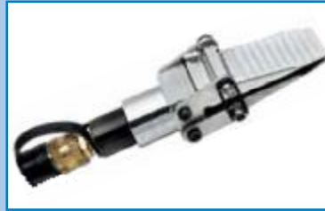
Separadores hidráulicos BETEX. Elevación y separación.