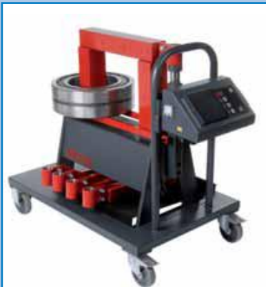
BETEX 38 ZFD de 12 ó 24 kVA Modelo rotatorio con brazo giratorio.