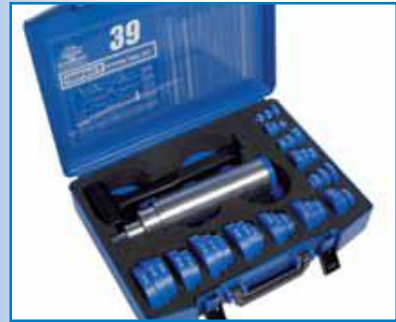
Juego de herramientas de adaptación Impacto 33 y 39. Montaje de rodamientos.