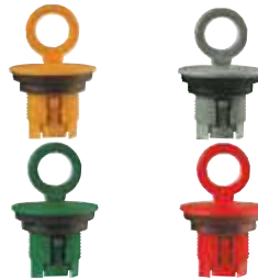
Tornillos de activación PERMA Para accionamiento electroquímico; distintos períodos de descarga.