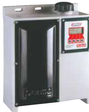
PERMA Ecosy Sistema de lubricación por aceite; alimentado por 240 V de CA.