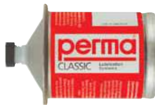
PERMA Classic Alojamiento metálico, accionamiento electroquímico.