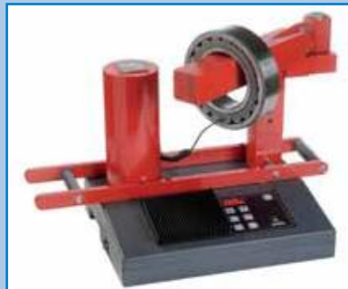
BETEX 24 RSD TURBO de 3,6 kVA. Modelo banco de trabajo con brazo giratorio.