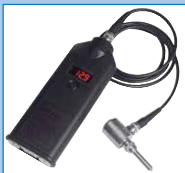
Medidor de vibraciones.