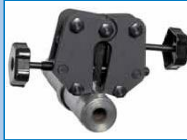
Extractor de llaves BETEX KZZ. Extracción de llaves segura y libre de daños.