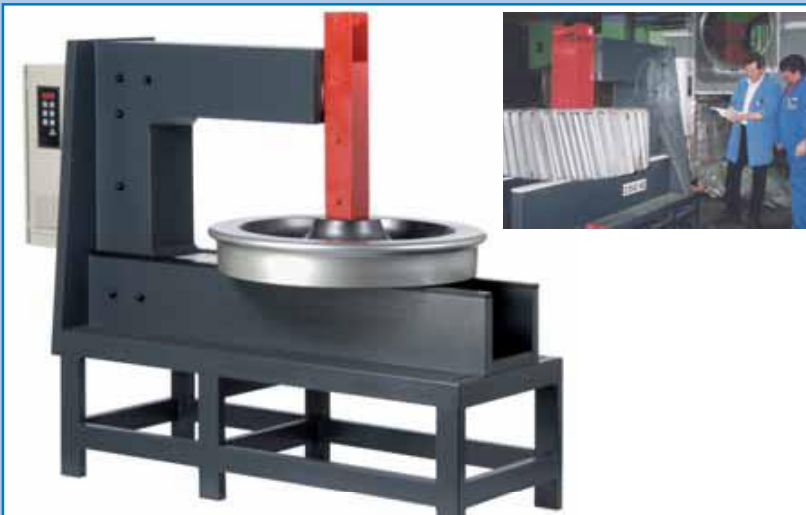
BETEX SUPER/GIGANT de 24-100 kVA Potentes calentadores de alto rendimiento.