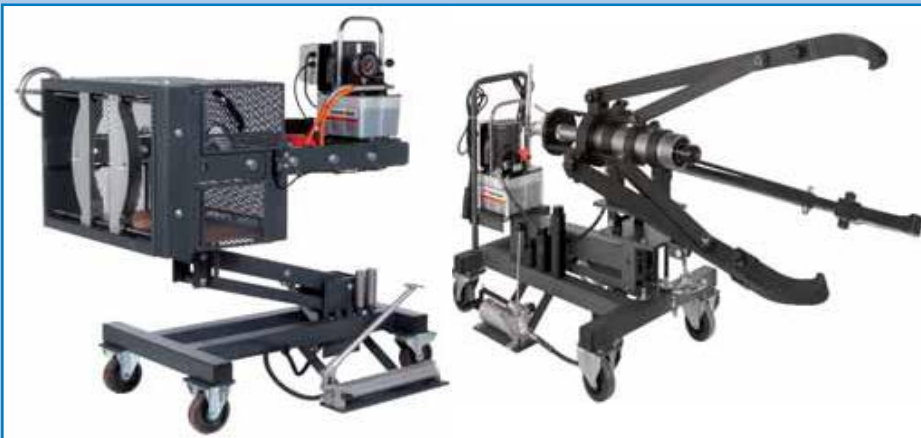
Extractor móvil BETEX, martinete hidráulico móvil con una capacidad de 25 y 50 toneladas.