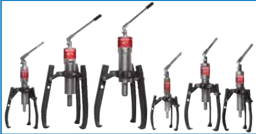
Extractores hidráulicos con bomba y cilindro integrados BETEX HP de 2/3 brazos y una capacidad de 4-30 toneladas.