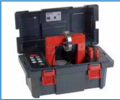
BETEX 22 ELD portátil de 3,6 kVA Calentador portátil.