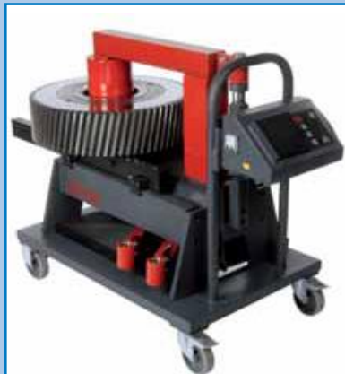
BETEX 40 RMD TURBO de 12 kVA Modelo rotatorio con brazo giratorio.