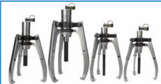
Extractores hidráulicos con centrado automático , bomba separada, BETEX HXP de 2/3 brazos, y una capacidad de 8-50 toneladas.