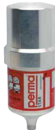
PERMA Heavy Duty Alojamiento metálico para circunstancias extremas (accionado por batería) tal como: altas/bajas temperaturas, alta presión, polvo y suciedad, sustancias corrosivas.