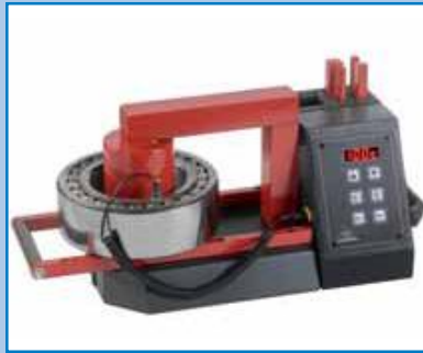
BETEX 24 RLD TURBO de 3,6 kVA Calentador portátil.