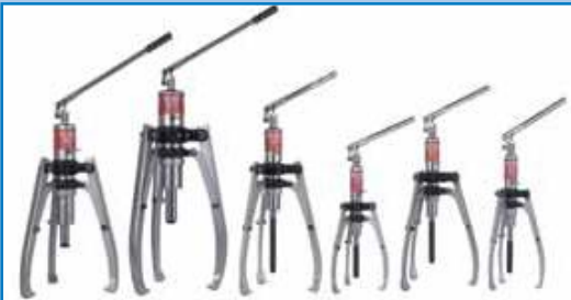
Extractores hidráulicos con centrado automático y bomba y cilindro integrados BETEX HSP de 2/3 brazos, y una capacidad de 4-30 toneladas.