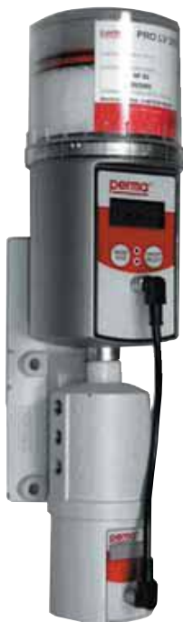
PERMA Pro Sistema de lubricación multipunto; 6 puntos de lubricación máximo con un Perma. Funciona independientemente de la temperatura. Con TDF o accionado por baterías. Máxima presión de trabajo: 25 bar.

* Solamente disponible en Benelux (Belgica, Luxemburgo y Holanda )