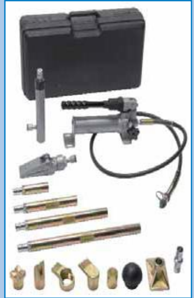
BETEX Portable Power kits. Conjuntos de mantenimiento hidráulico, con una capacidad de 4 y 10 toneladas.