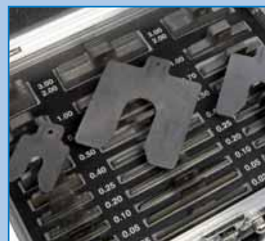
Espaciadores para la alineación de ejes Listos para usar, de bronce o acero inoxidable.