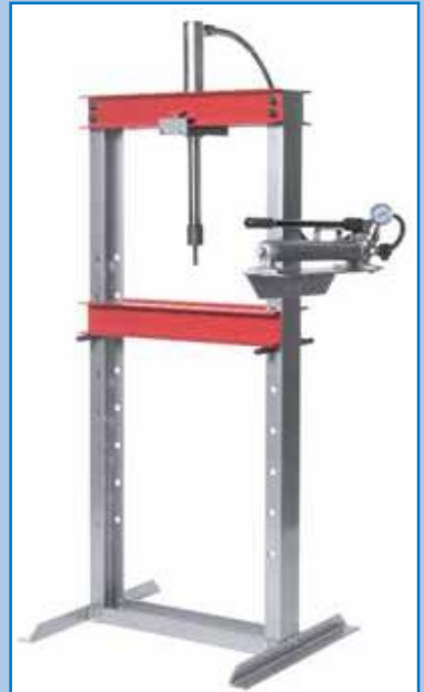
Prensas de taller WSP. Con bomba manual, de aire o eléctrica.