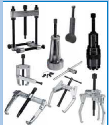
Extractores universales BETEX. Selección de excelentes extractores.