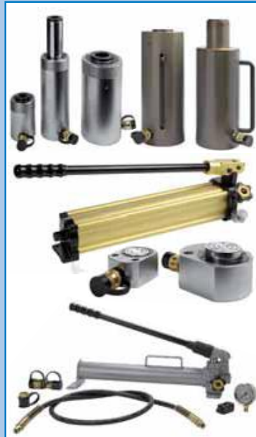
Equipos hidráulicos BETEX. Marca propia, cilindros, gatos.