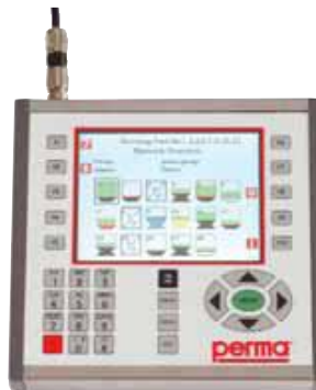
PERMA Net Sistema de lubricación multipunto.