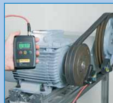
Sistemas de alineación de poleas Tecnología láser.