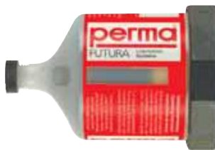
PERMA Futura Alojamiento de plástico transparente, accionamiento electroquímico.