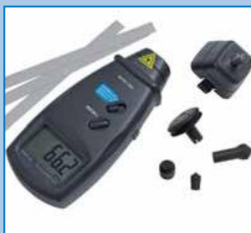
Tacómetros (de y sin contacto).