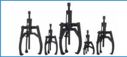
Extractores mecánicos con centrado automático BETEX MSP de 2/3 brazos, cap. 2-10 toneladas.

for reliable rotation in maintenance and production