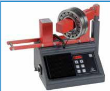
BETEX 22 ESD de 3,6 kVA. Modelo banco de trabajo con brazo giratorio.